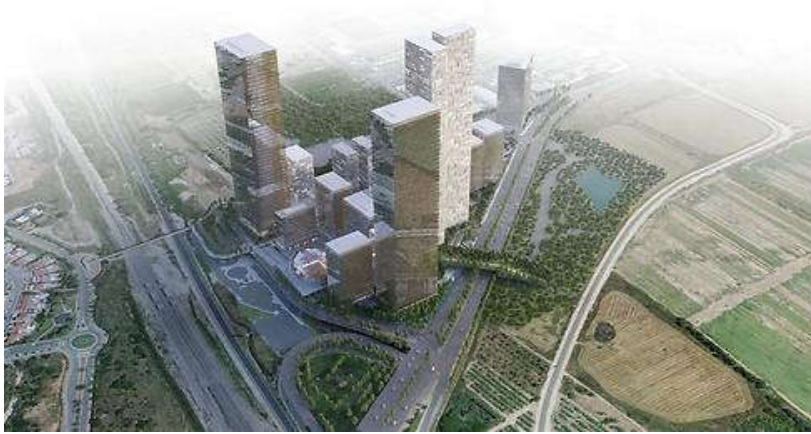
הדמיית פרויקט קריית שחקים בהרצליה. מגדלים עם 67 קומות ויותר (הדמיה: דוברות עיריית הרצליה)